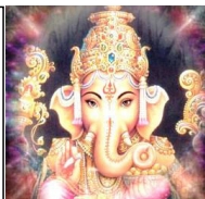
Ganeša ili Ganapati je uzetno popularan bog u Indiji

„131. Pošto je nebesko svjetlo (svjetlo u Nebu) Božanska Istina, tako je to svjetlo i Božanska Mudrost i Razumijevanje; Stoga se pod: „biti uzdignut u nebesko Svjetlo“ podrazumijeva isto što i „biti dana Božanska Mudrost i Razumijevanje i time biti prosvjetljen“. Radi toga je svjetlost anđela odgovarajuća stupnju njihove Spoznaje i Mudrosti. Jer je svjetlo Neba Božanska Mudrost, tako u tom svjetlu bivaju svi prepoznati (viđeni), onako kako su građeni (po karakteru). Nutrina svakog pojedinca tamo „leži otvorena na svjetlu dana“ i odražava se na njegovom licu i to potpuno onako kakav je čovjekov karakter,